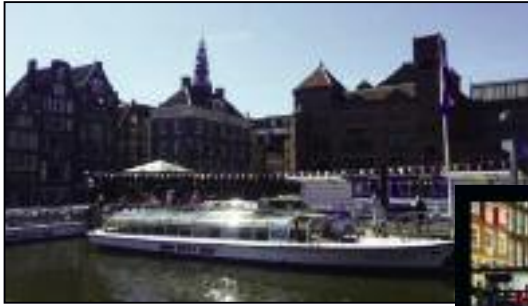
GAND & AMSTERDAM